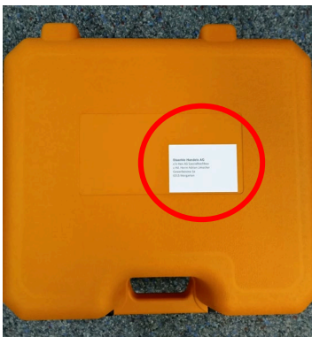
Etikette auf glatten sauberen Teil kleben

Arthur Weber AG c/o Müller Maschinen + Fahrzeuge AG Gewerbezone 3a 6315 Morgarten