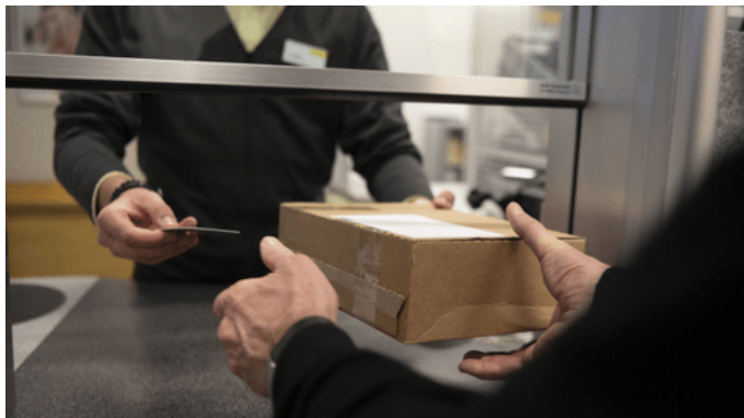
Paket bei der nächsten Postfiliale aufgeben, Quittung zur Nachverfolgung aufbewahren